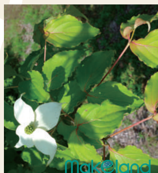
花と葉のイメージ

□害虫駆除…植物は生き物ですので、害虫に被害を受けたり病気になることもございます。