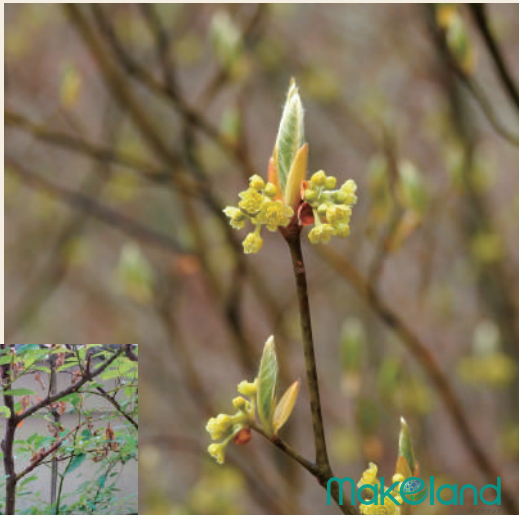
新芽と花 イメージ